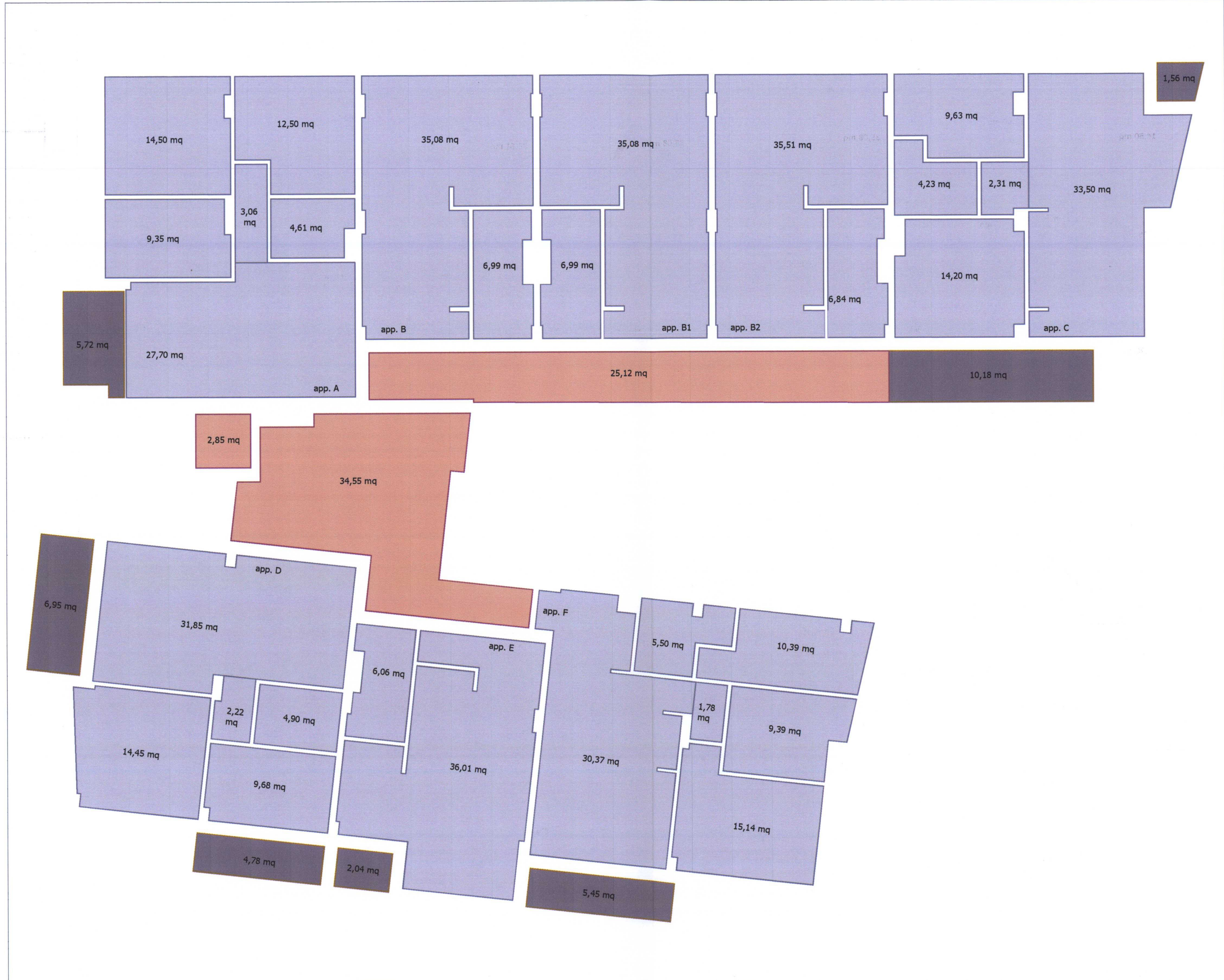
DETERMINAZIONE DELLE SUPERFICI PER LA VERIFICA DELLA CONGRUITA' DEI COSTI - PIANTE PIANO TIPO (PRIMO-SECONDO-TERZO) - SCALA 1:100